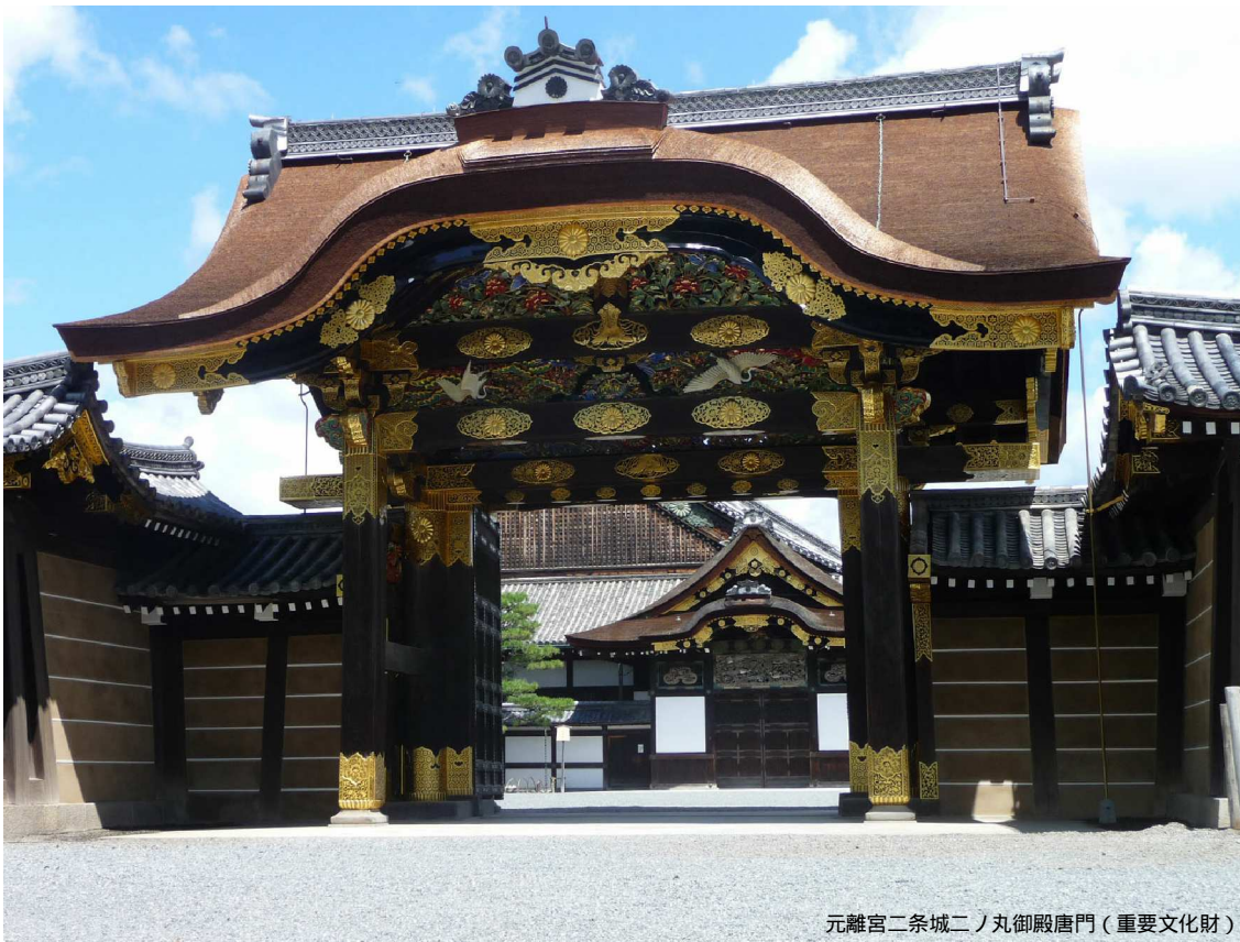
元離宮二条城二ノ丸御殿唐門（重要文化財）