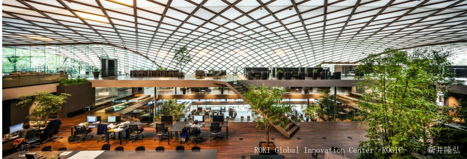
ROKI Global Innovation Center -ROGIC-