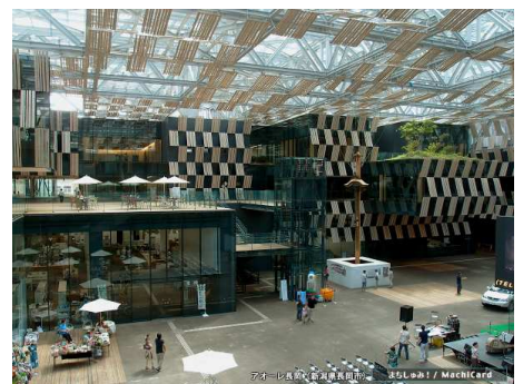
見学地 5. アオーレ長岡（隈研吾建築都市設計事務所）