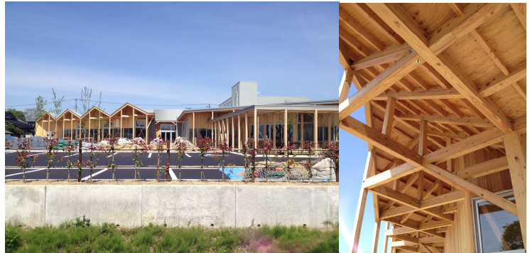
見学地 1. 三条の川通どれみ保育園（長岡造形大学 山下秀之教授）